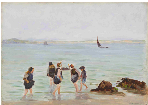
Joseph-Félix Bouchor, Les pataugeuses (Début XXe siècle)