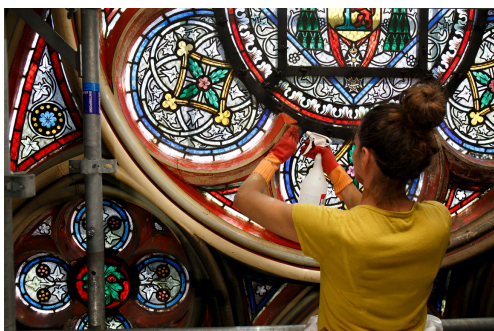
Nettoyage des vitraux dans la cathédrale

Beaux-arts, architecture, cultures scientifiques, spectacle vivant..., cette galerie virtuelle incite à la curiosité, s'adresse à tous les publics, et se décline en un véritable outil d'éducation artistique et culturelle. Elle réunit plusieurs milliers de chefs d'oeuvre de nombreuses institutions et musées à découvrir en visite libre ou en mode conférencier.