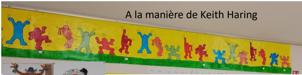
A la manière de Keith Haring